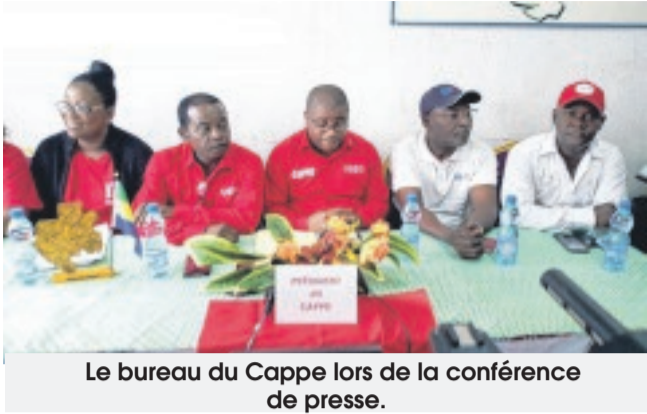
Le bureau du Cappe lors de la conférence de presse.

Le congrès des agents publics, parapublics et privés de l'État (Cappe) a organisé, jeudi dernier, une conférence de presse autour de deux points : compte rendu de la 108e session de la Conférence internationale du travail (CIT) à laquelle a pris part cette centrale syndicale à Genève (Suisse), du 10 au 21 juin dernier, et des