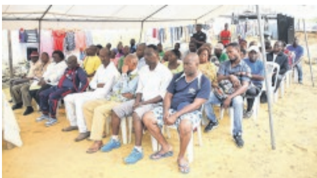
... des Cocotiers. Ici, les populations du quartier suivant l'intervention de leur élu.

et les autres à suivre les activités de l'Assemblée nationale par l'entremise de la chaîne de télévision publique (Gabon 1ère) qui transmet désormais, en direct, chaque mercredi, la séance des "questions orales aux membres du gouvernement". À noter qu'à chaque étape, l'exposé du député a été suivi par un jeu de questions-réponses