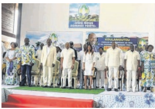
Les officiels lors de la rencontre.