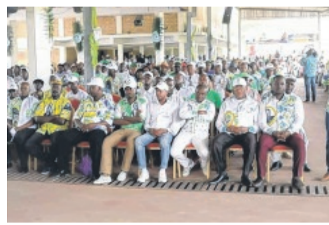
Une vue des militants.