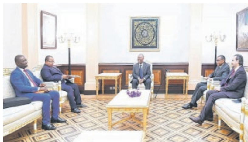
Une phase de la séance de travail avec le ministre des Transports