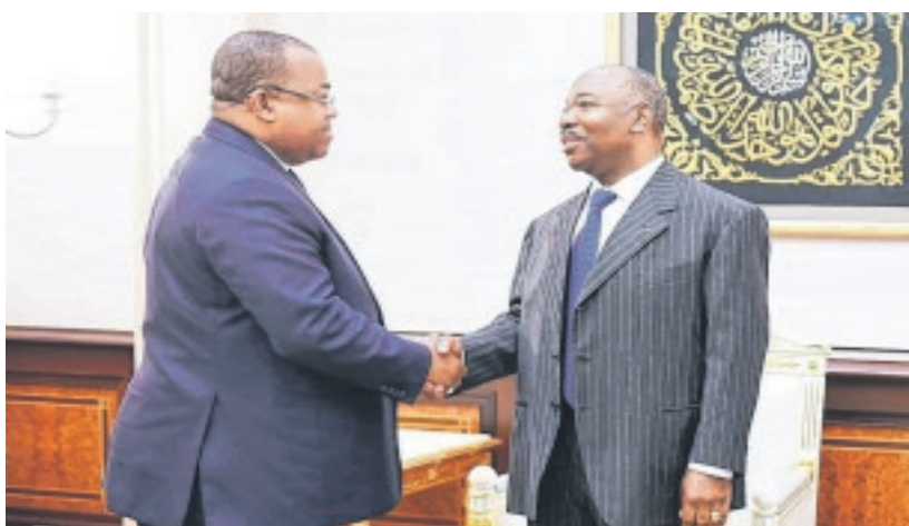
Le président de la République, Ali Bongo Ondimba et le chef du gouvernement, Julien Nkoghe Bekale.