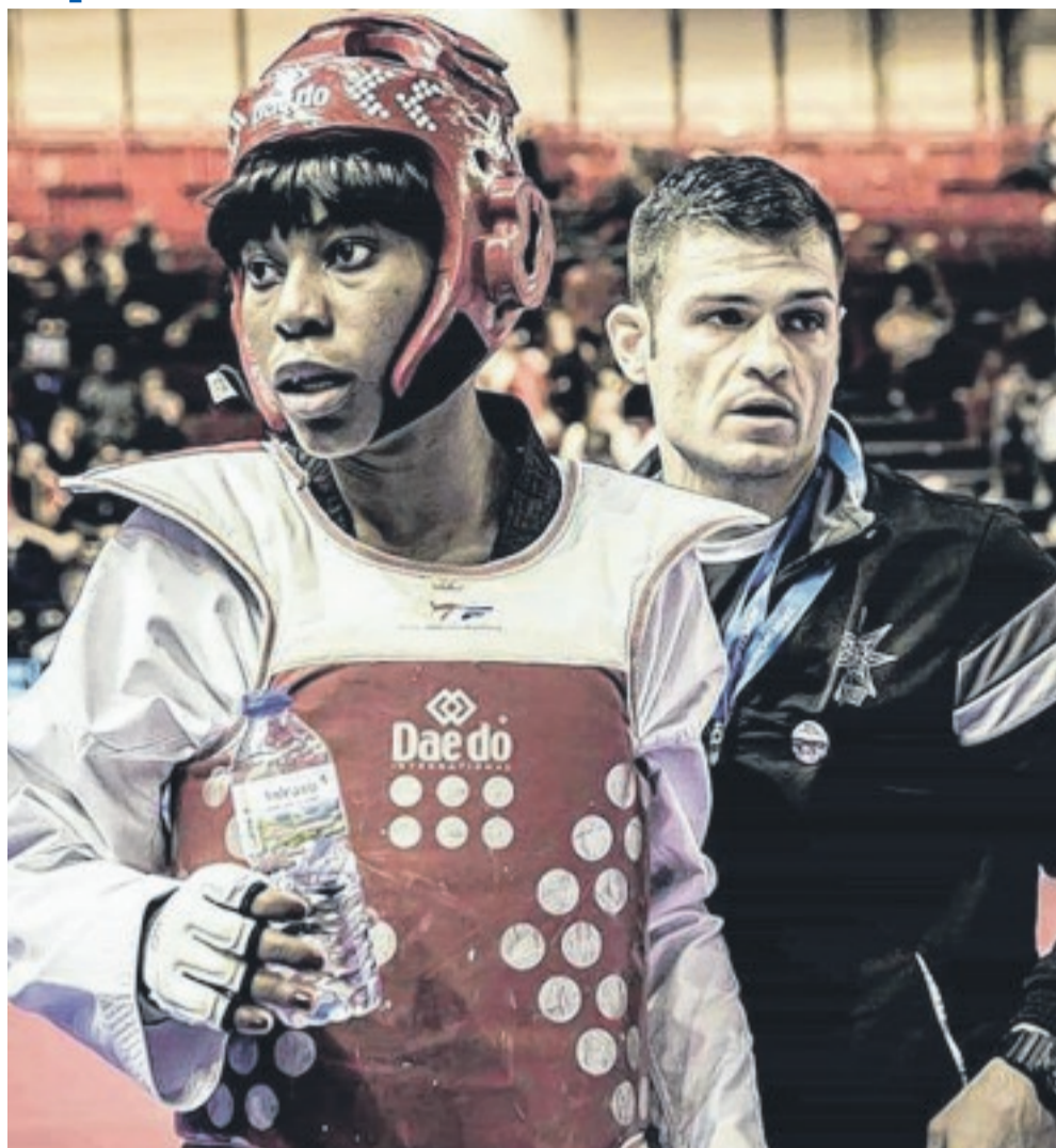
Urgence Mouegha chante presque un air de revanche.