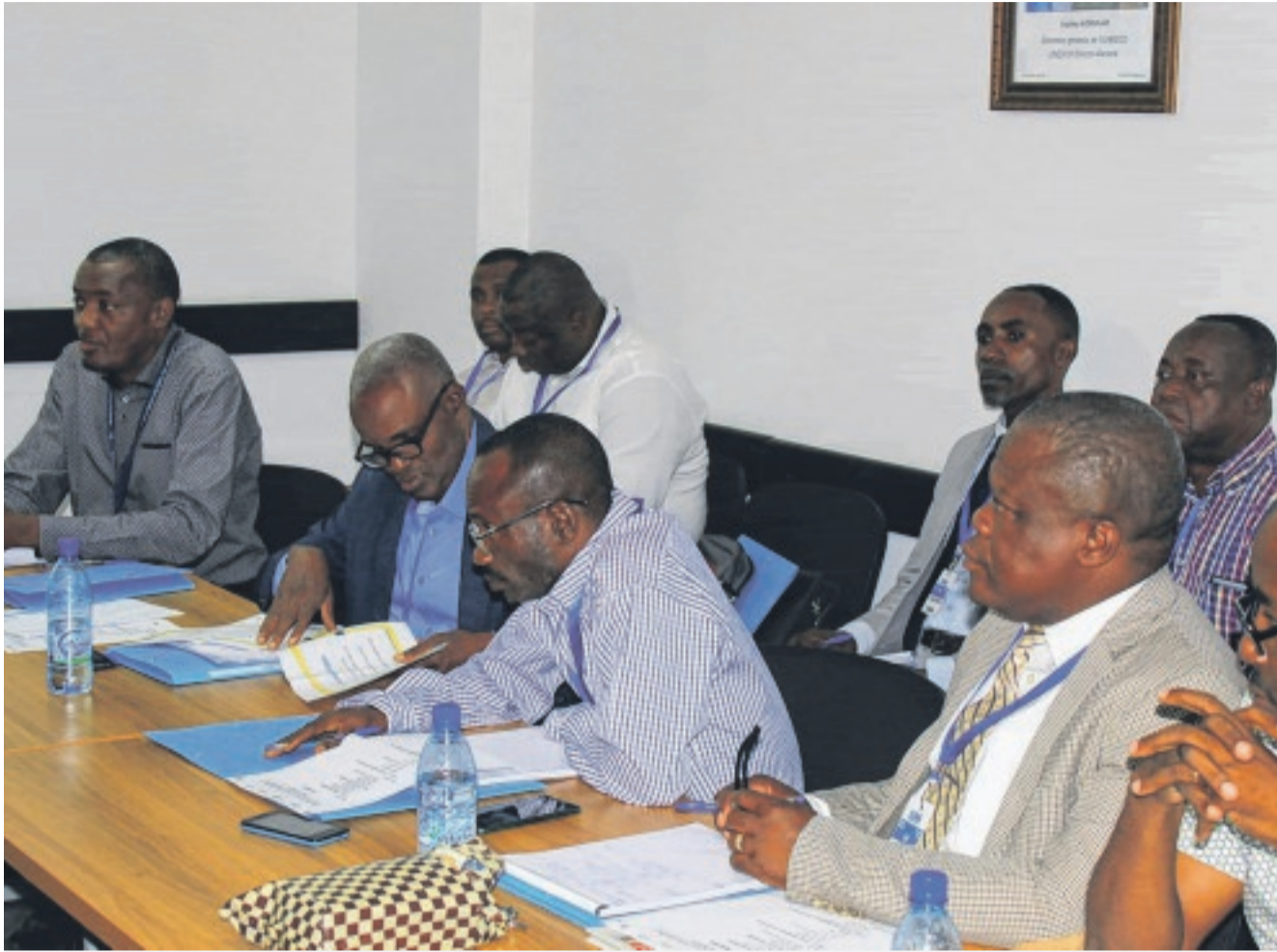
L'atelier d'élaboration du plan de l'annuaire statistique s'achèvera jeudi prochain.