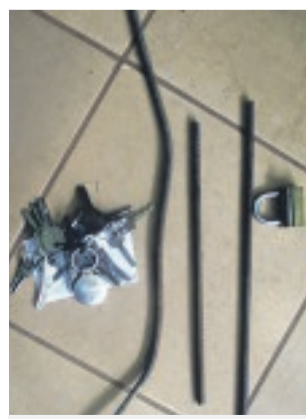
Les outils qu'ils utilisaient pour parvenir à leurs fins.