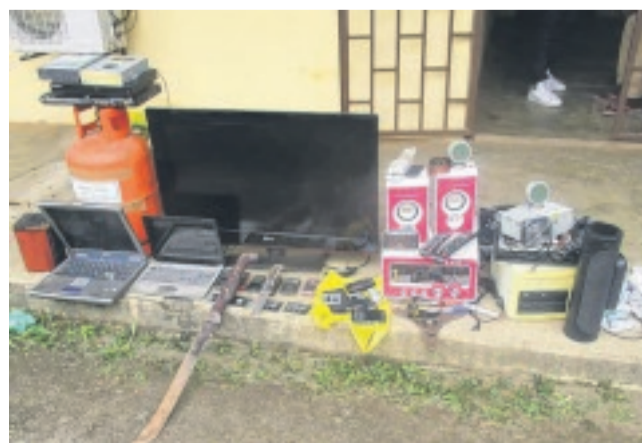
Une partie du butin dérobé par les malfrats

d'une importante quantité de chanvre indien. Ils ont également découvert plusieurs effets volés : une dizaine de téléphones portables emballés dans un sac, un téléviseur écran plasma, du matériel hi-fi, des bouteilles de gaz, etc. ARMES BLANCHES • Plu-