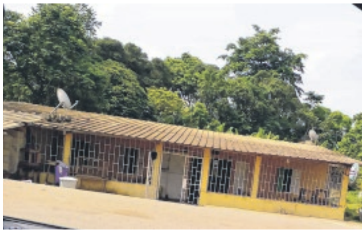
C'est derrière ce bar appelé «La Prison» que Delphine Bikene a reçu les coups de couteau mortels.