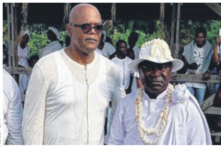
Samuel L. Jackson : arrivé au Gabon le 23 juillet dernier, à la recherche de ses origines Benga, cette star américaine du cinéma a été fait citoyen gabonais et reconnu au sein de sa communauté naturelle comme un dignitaire du terroir.