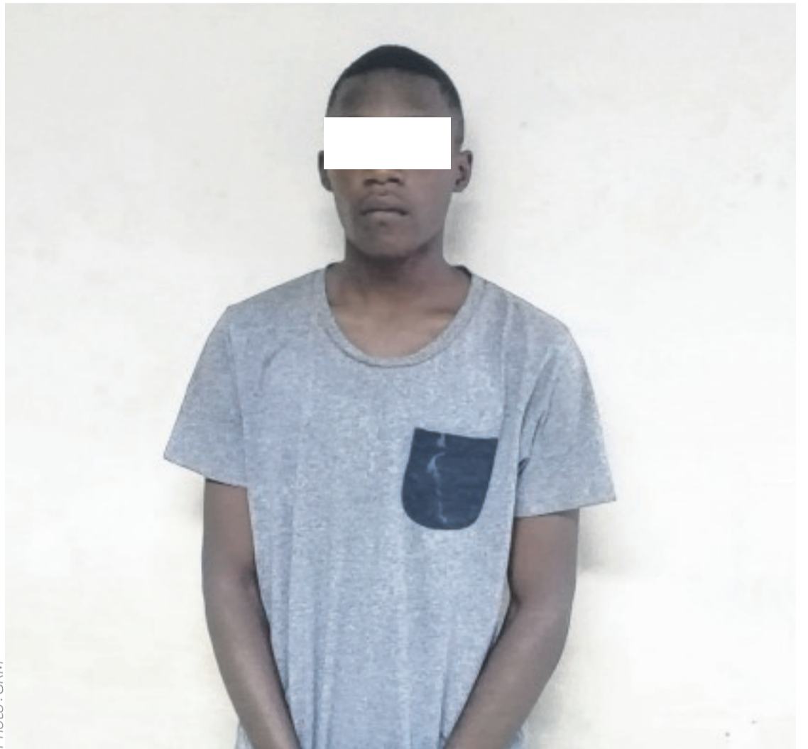
Le mis en cause.

C'est du moins ce qu'il aurait confié au service des mœurs et de protection des mineurs de la Direction des affaires criminelles (DAC). Les images à la disposition de la DAC présentent la partie anale de l'enfant pleine de sang. La forfaiture aurait été découverte par la mère de la victime, au moment de lui faire sa toilette. Elle aurait d'abord porté l'affaire au niveau de la Direction générale des recherches (DGR) où elle n'aurait pas reçu de suite favorable. Nullement découragée, la maman de la victime saisit la DAC qui commandera une expertise médicale. Celle-ci confirmera le viol par sodomie. Interpellé, E.J.E. passe aux aveux. Le présumé violeur sera bientôt présenté devant le parquet de Libreville.