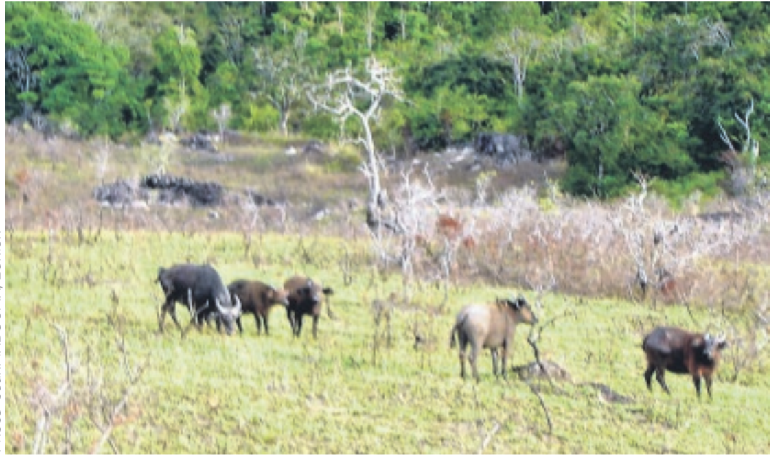
Un pan de la biodiversité de la Lopé.

La biodiversité offre, en outre, d'innombrables services, tant au niveau local que mondial. Les poissons assurent 20 % de l'apport protéique à environ 3 milliards de personnes. Plus de 80 % de l'alimentation des êtres humains est assurée par des plantes. Près de 80 % des habitants des zones rurales des pays en développement ont recours aux médicaments traditionnels à base de plantes, pour les soins de base. En effet, c'est la combinaison des formes de vie et leurs interactions les unes avec les autres et avec le reste de l'environnement, qui a fait de la terre un endroit unique