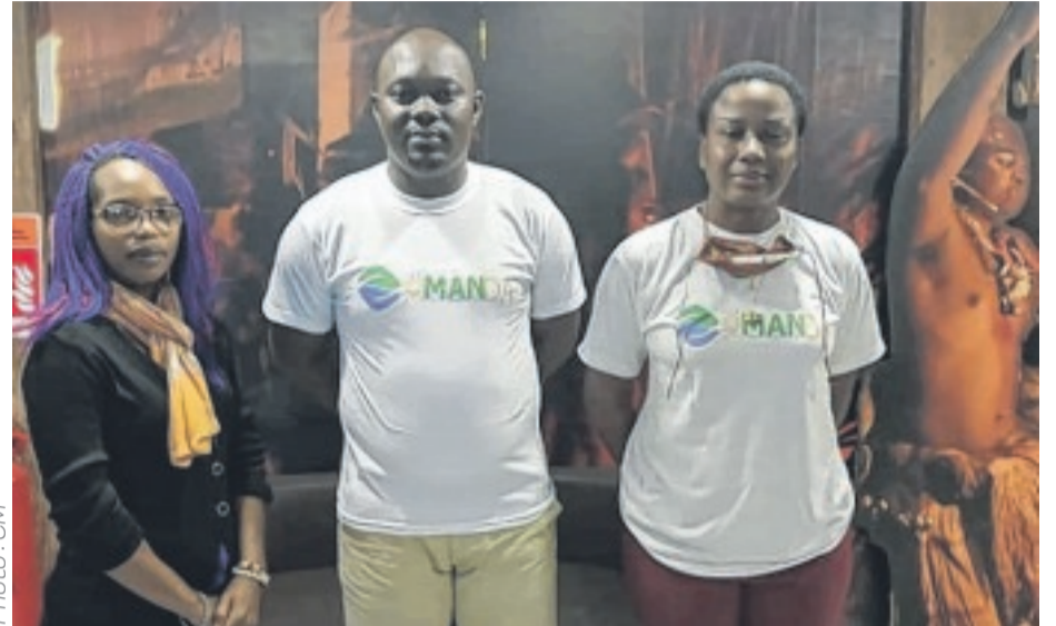
Les membres de l'ONG Omanda après leur déclaration.

été faits ces dernières années, le coordonnateur de l'ONG estime, cependant, que beaucoup reste à faire. "Omanda s'aligne sur la politique du chef de l'État, Ali Bongo Ondimba, qui place la jeunesse au cœur de son septennat. Il est donc urgent aujourd'hui d'accepter de mener des actions communes en faveur de tous les enfants de l'Afrique, y compris des communautés isolées telles que les Pygmées", a-t-il affirmé.