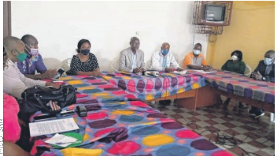
Une vue des membres du bureau exécutif du Sena lors de la rentrée hier à Libreville de cette organisation syndicale.

En outre, s'agissant des mesures prises après la suspension des cours consécutivement au confinement, notamment l'instauration de l'enseignement à distance, le Sena demande la connexion de tous les établissements scolaires en internet et leurs équipements en outils informatiques divers, pour l'expansion et la vulgarisation de ce moyen d'enseignement qui vient en appui à l'enseignement en présentiel.