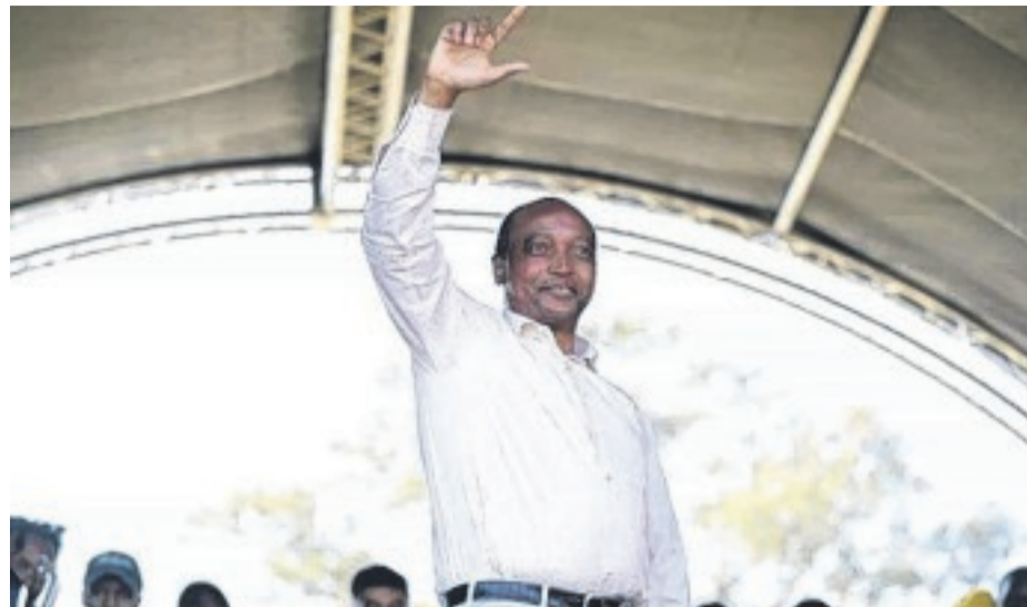
Un deuxième concurrent vient de se manifester pour la candidature à la tête de la Caf. Il s'agit du Sud-Africain Patrice Motsepe.