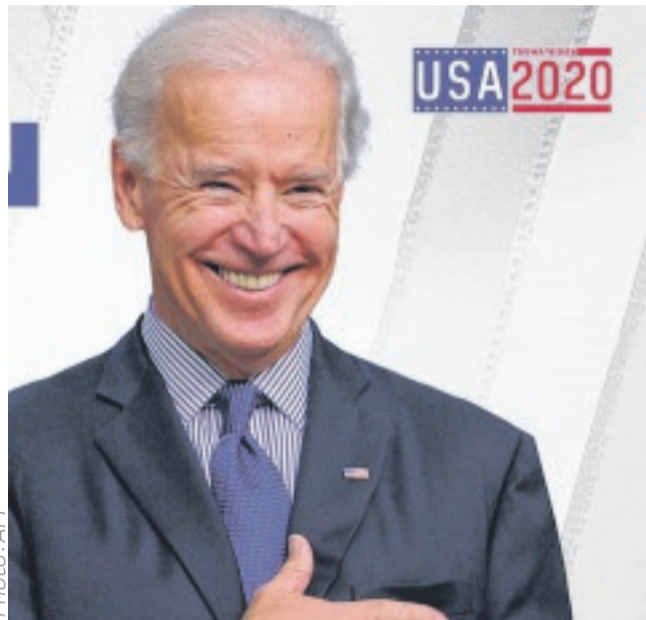
Joe Biden, sûr d'être le prochain locataire de la Maison Blanche.