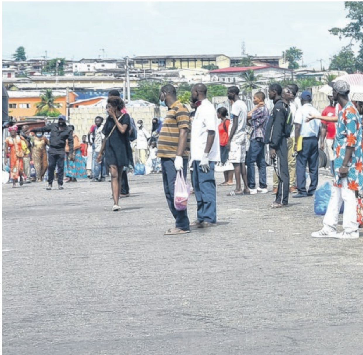
Les autorités redoutent une seconde vague.

Mais personne ne veut revivre ces douloureux épisodes qui ont, entre autres, mis à mal des pans entiers de l'économie. Raison pour laquelle le gouvernement insiste, depuis plusieurs semaines, sur la nécessité, pour les populations, de bien se protéger.