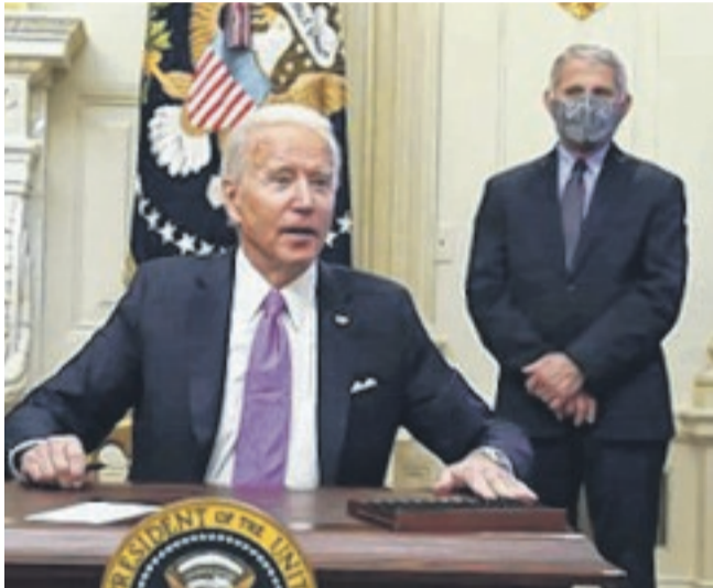
Joe Biden relance la politique africaine de son pays

Jonas OSSOMBEY (sources : AFP) Libreville/Gabon