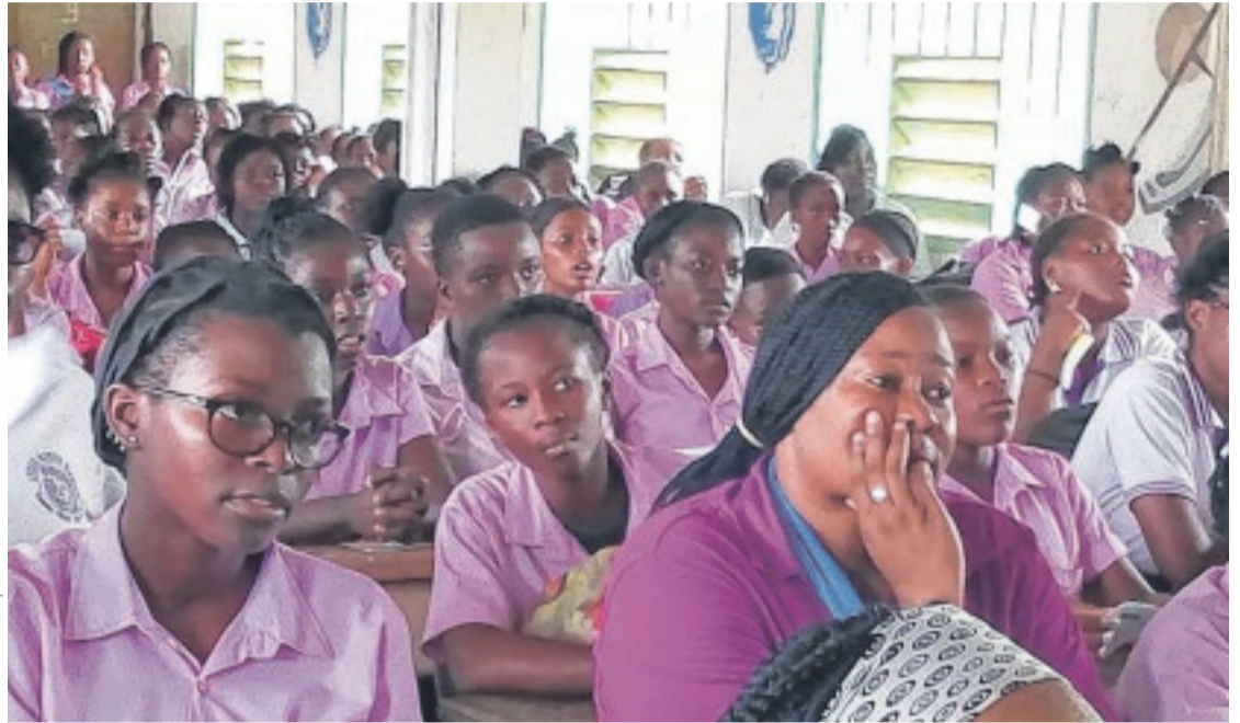
Des élèves du lycée Djoue Dabany lors d'une campagne de sensibilisation.

le 15 février à 7 h 30) et seront astreintes à des travaux d'intérêt général dans l'établissement. Si la décision des responsables de LDD n'est pas celle imaginée par l'opinion, elle va cependant maintenir ces quatre élèves de 2 nd e et 1 re sous pression. En effet, elles devront rédiger une charte de bonne conduite des élèves du lycée Djoue-Dabany, avec l'appui des chefs de départements de français et éducation civique qui sera présentée et lue, lors du rassemblement général, au drapeau, le 15 février à 7 h 30; prendre part à toutes les activités de sensibilisation menées par les services spécialisés, sur les problématiques de la propagation de la pandémie de Covid-19, des dangers des réseaux sociaux; se soumettre