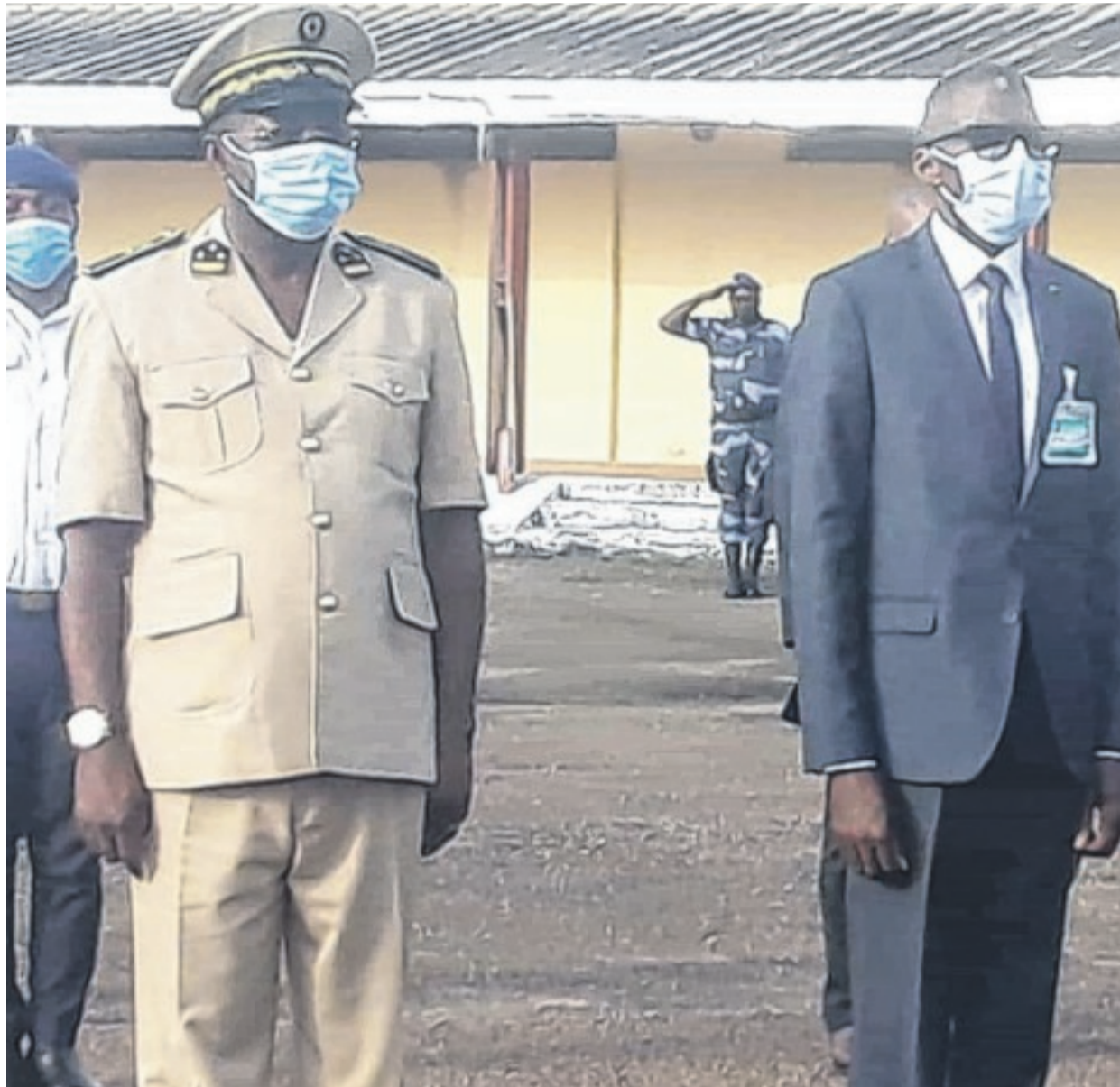
Le ministre d'état, ministre de l'intérieur et celui de la défense à leur arrivé à Port-Gentil

À noter que, dans les jours à venir, Lambert-Noël Matha et Michaël Moussa Adamo se rendront dans d'autres localités du pays.