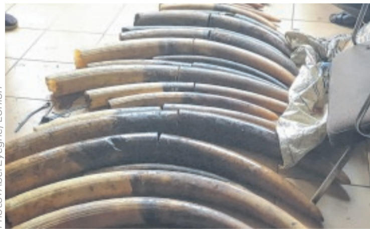
Le Gabon renforce sa lutte contre le braconnage.

Selon l'ONG, grâce à ce projet, 19 opérations ont été réalisées par les Eaux et Forêts et les forces de l'ordre. Ainsi, sur les 54 personnes poursuivies, AALF a facilité l'obtention de 44 condamnations fermes variant de 180 à 730 jours, avec une moyenne de 487