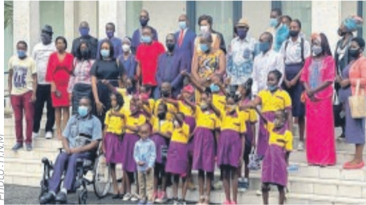
La photo de famille à l'issue de l'événement.

À l'occasion de la 21 e Journée internationale des langues maternelles, Bolloré Transport & Logistics-Gabon a apporté sa contribution aux manifestations organisées par l'ONG Omanda, samedi écoulé, au Musée national des arts, rites et traditions du Gabon. Omanda, qui réunit un millier de membres désireux de promouvoir la culture gabonaise, notamment les langues maternelles, a mobilisé des jeunes à Libreville. Autour du thème "Vive nos langues maternelles", cette célébration a été marquée par une série d'animations orchestrées par les jeunes de l'école Belle porte académie de Libreville, des traditionalistes et des acteurs culturels. "Notre partenariat avec Bolloré Transport & Logistics nous permet de renforcer notre action en matière de promotion des langues ma-