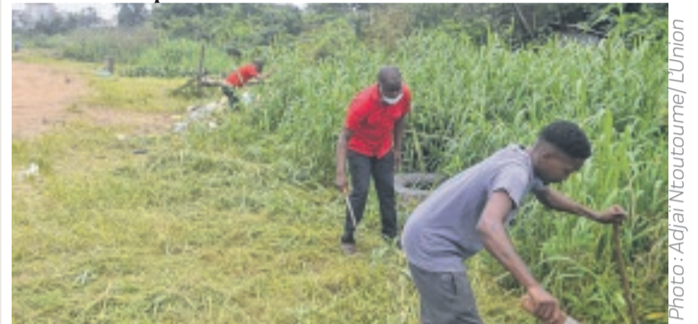
Les volontaires donnant un éclat à cette partie du 3 e arrondissement de Libreville.