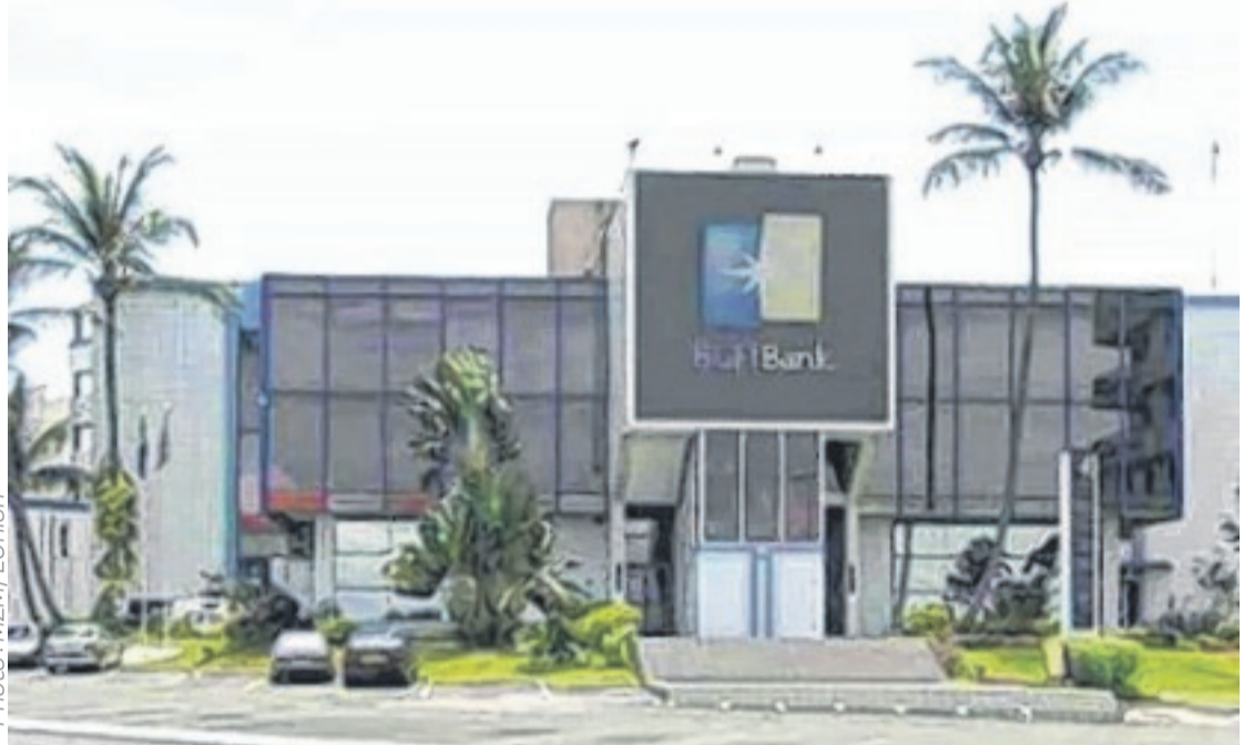
Vue du siège social de BGFIBank.