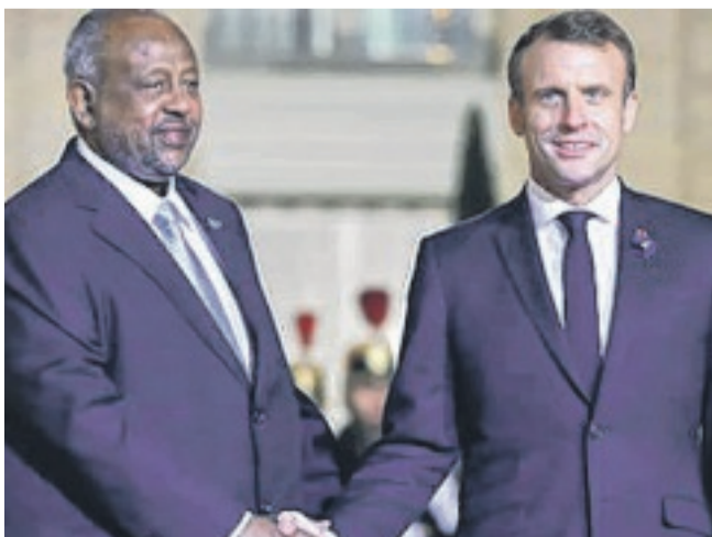
Les présidents Macron et Guelleh

Il faut rappeler qu'en mai 2014, un commando suicide avait attaqué un restaurant prisé des étrangers à Djibouti, faisant un mort, un Turc, et au moins une vingtaine de blessés, dont sept Français, quatre Allemands, trois Espagnols et six Néerlandais. Dans leur revendication, les shebabs avaient expliqué avoir attaqué un « restaurant fréquenté surtout par des Croisés français et leurs alliés de l'Otan ».