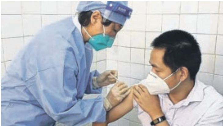
Administration du vaccin Sinopharm à l'hôpital sino-gabonais de Libreville.