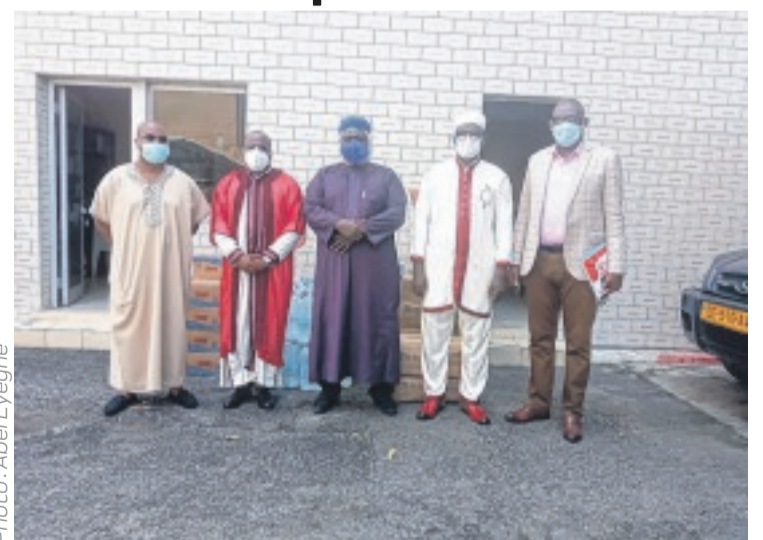
Photo de famille à l'issue de la réception du don.

Il s'agit de packs d'eau, de paquets de sucre, de café, de dattes et de boîtes de lait. Des produits traditionnellement consommés pour la rupture de la journée de jeûne. " Nous avons souhaité apporter un soutien à nos frères musulmans en ce mois béni de ramadan. Par la grâce d'Allah, nous espérons pouvoir refaire des actions similaires d'ici la fin du carême, avec les modestes