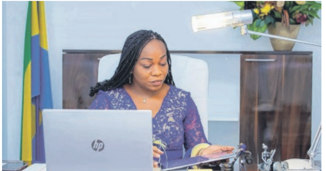
Mme Prisca Nlend-Koho, ministre des Affaires sociales et des Droits de la femme