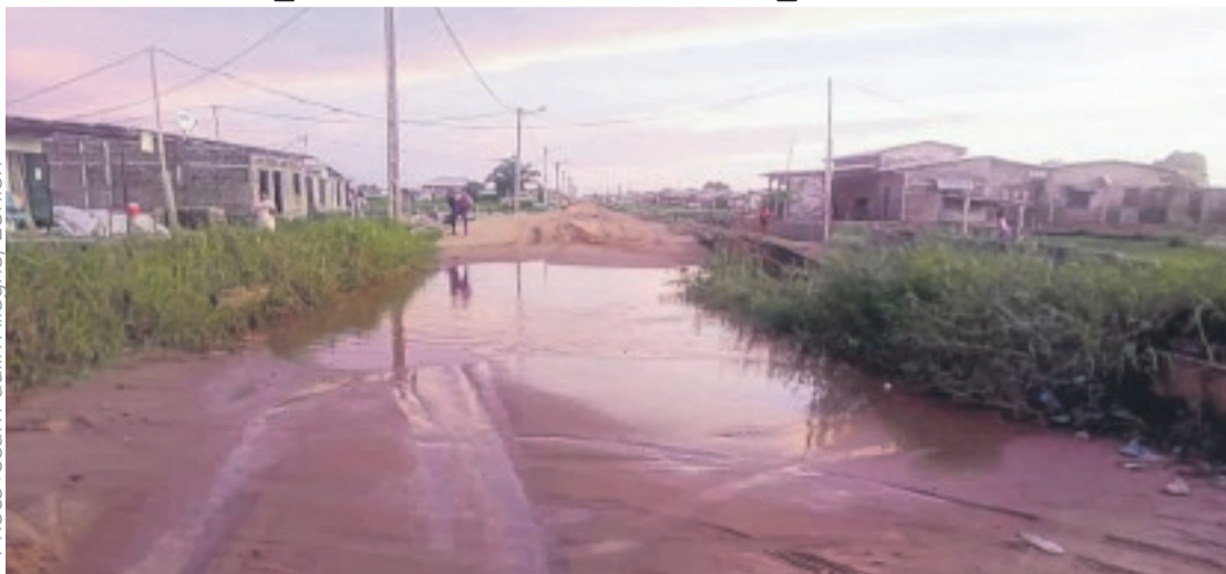
Un pan du quartier île Mandji, où les faits ont eu lieu.

Pendant cette période, poursuit notre source, Emile Pascal Ngoma, propriétaire d'une église au quartier Île Mandji, "avait deux de ses fidèles qui étaient malades. Il leur a passé le même message en leur promettant de les guérir, lorsqu'il serait ressuscité. Mais pour cela, ils devaient l'attendre à l'église".