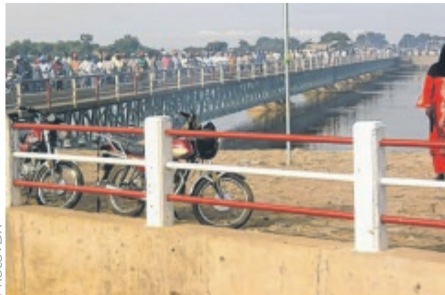
Le pont Ngueli traversé par de nombreux esclaves