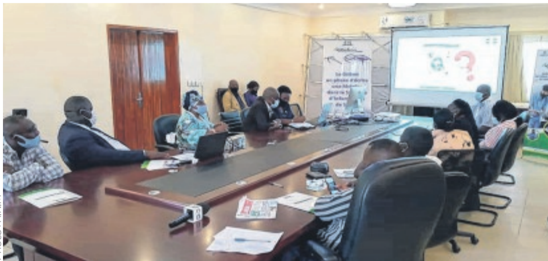
Une phase des travaux.