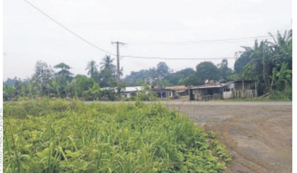
Le corps du jeune homme a été découvert non loin de ces habitations.