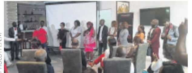
Ce nouveau film veut briser le silence des femmes.

tement dénoncer les violences conjugales subies par les femmes en les invitant à briser le silence. Une œuvre qui enrichit le paysage cinématographique gabonais et participe à la lutte contre les violences à l'égard des femmes.