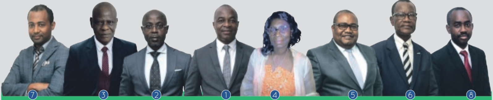
TABLEAU DE L'ORDRE 2021

ORDRE NATIONAL DES EXPERTS COMPTABLES DU GABON