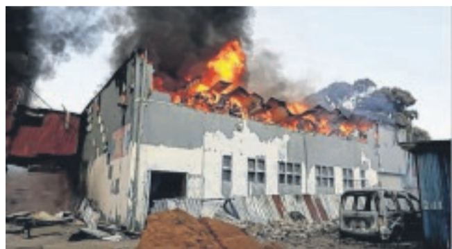
Des dégâts matériels importants.