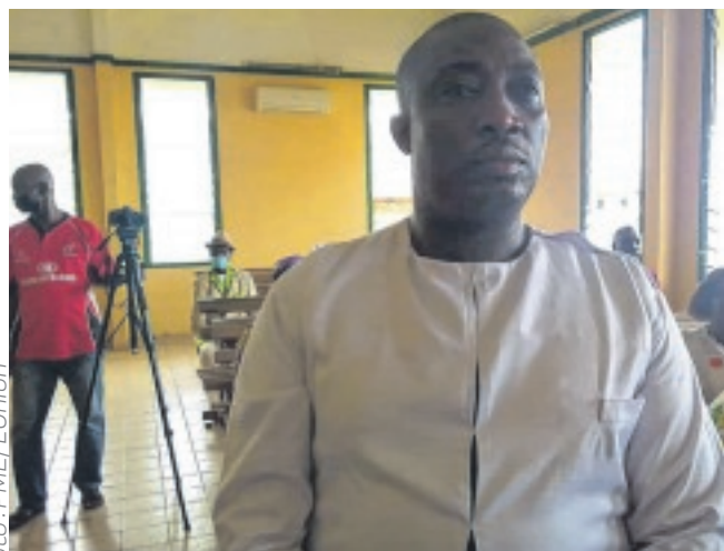
L'ancien membre du bureau de l'US a adhéré au PDG.