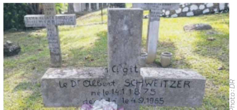
La sépulture du Dr Schweitzer à Lambaréné où un hommage lui sera rendu ce week-end.

C'est dire si cette cité honore ce week-end la mémoire du plus illustre de ses ambassadeurs.