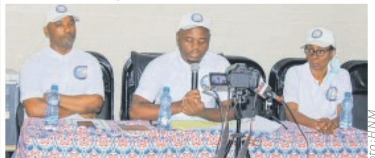
Le collectif lors du point de presse.