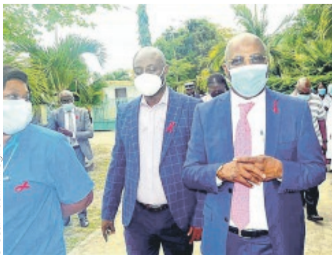
Le gouverneur lors du lancement d'Octobre rose à Port-Gentil.

"Le démarrage est désormais effectif, mais l'engouement n'est pas encore au rendez-vous. Nous osons espérer qu'il y aura plus des femmes au fil des jours qui viendront se faire dépister. Aujourd'hui, beaucoup de femmes meurent ou ont des complications de santé à cause des cancers du sein ou du col de l'utérus sans le savoir. C'est l'occasion, pour elles, de venir se faire dépister pour être fixées sur leur statut médical", a conseillé le gouverneur de l'Ogooué-Maritime, Paul Ngome Ayong, à l'ouverture de l'édition 2021 de la campagne d'Octobre rose.