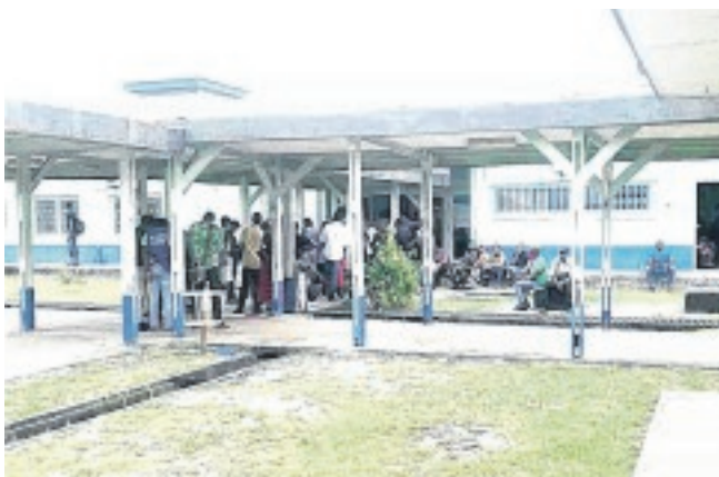
Des volontaires venus se faire vacciner contre le Covid-19 au centre de Ntchengué.

Toute chose que désirent plusieurs franges de la population portgentillaise, convaincue de ce que le vaccin est le "meilleur moyen" de limiter la propagation du coronavirus dans notre pays.