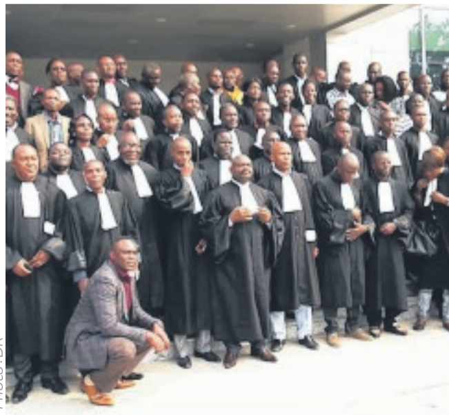
Ce sont deux procédures que les avocats ont engagées contre l'Etat.

Pour l'avocat des riverains, le préjudice de ces derniers est important notamment au niveau de l'éducation et de la santé : « Vous vous rendez compte qu'il y a des personnes qui si elles tombaient malades, ne pourraient pas accéder à des centres de santé. Il y a des écoles où l'aire de jeux, la cour a été complètement emportée. Donc, les enfants ne peuvent plus aller à l'école. Nous estimons qu'il y a des grands préjudices pour lesquels nous saisissons en son temps le juge pour qu'il y ait une condamnation à l'égard de l'Etat tchadien en réparation des préjudices occasionnés ».