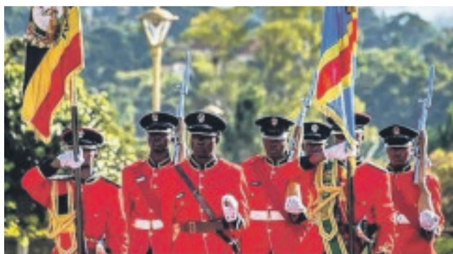
L'armée ougandaise va entrer dans l'est de la RDC.

Pour plusieurs observateurs, membres de la société civile mais aussi internationaux, la probable arrivée d'une autre puissance militaire en Ituri et au Nord Kivu est une menace de plus pour les civils. Ils estiment notamment que les ADF sont mêlés aux habitants ce qui rend difficile leur identification. « Les Ougandais y arriveront-ils mieux que les FARDC ou que la Monusco ? s'interroge un des interlocuteurs. C'est possible mais ce n'est pas assuré non plus ».