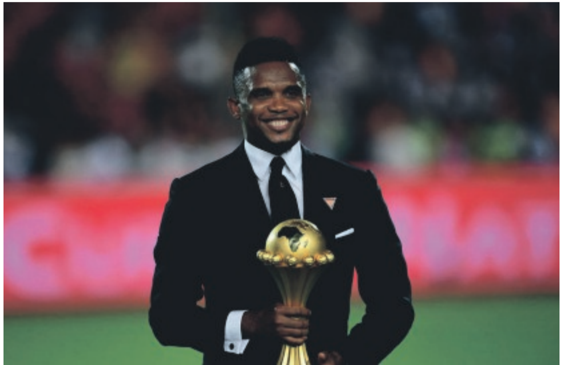
Avec Eto'o, c'est l'avènement d'un nouveau type de dirigeant sportif sur le continent.

La victoire d'Eto'o ne sera pas sans renforcer les velléités de ces stars africaines désireuses d'aider le football de leur pays à se développer (Emmanuel Adebayor au Togo et Shabani Nonda en RD Congo, par exemple).