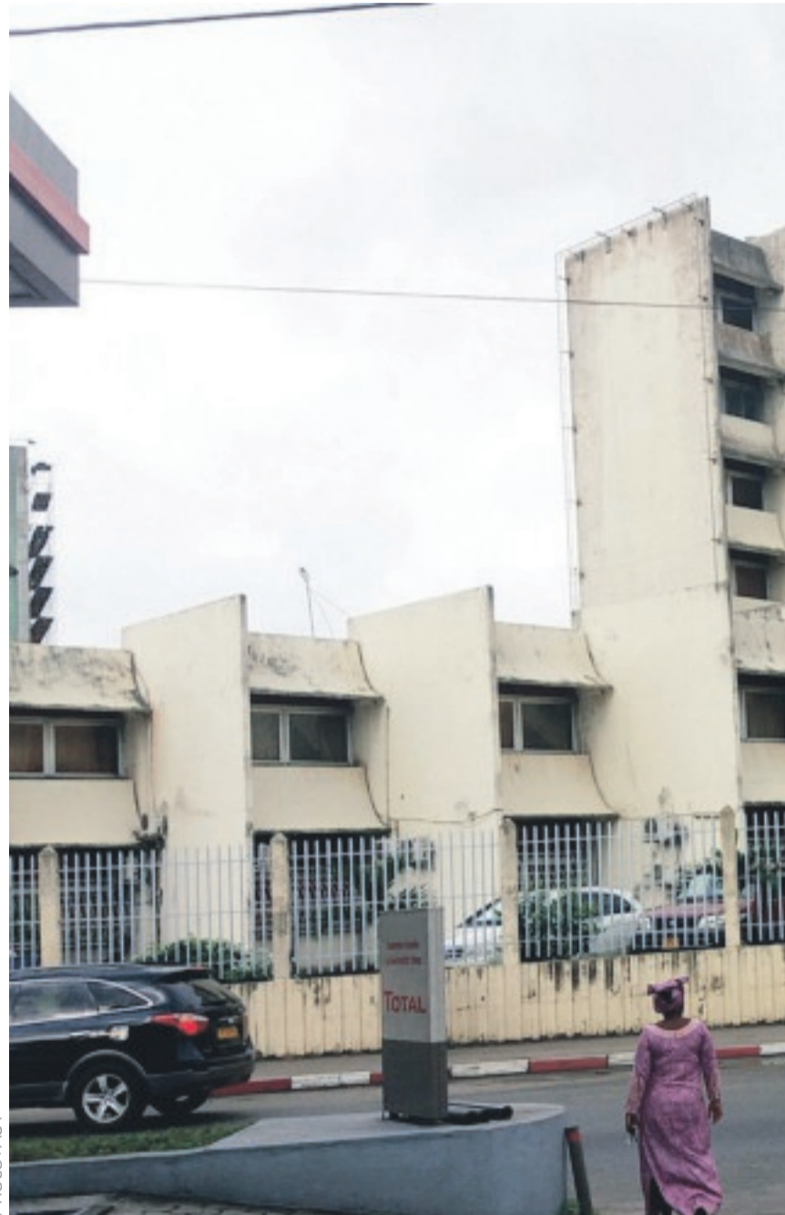
Libreville risque d'être bien silencieuse ce mercredi.

cinale du gouvernement. A Port-Gentil, en novembre dernier, la Coordination provinciale de régulation de l'action syndicale s'était indignée contre l'atteinte à des droits fondamentaux. Et avait alors invité les populations à une ville morte d'avertissement de trois jours pour le 24 novembre dernier. Beaucoup ignorent sur quoi cette journée de mercredi va déboucher. La ville morte sera-t-elle suivie, le gouvernement pourrait-il reculer sur certains points, les syndicats vont-ils durcir le mouvement de contestation ? Difficile de répondre pour le moment à ces interrogations. On sait par contre, selon le Copil, que les centres de vaccination sont actuellement pris d'assaut. Ainsi, les deux sites mobiles de vaccination de l'ex-Gare routière ont vacciné un peu plus de 520 volontaires samedi passé. Contre 800 personnes du côté du vaccinodrome d'Angondjè.