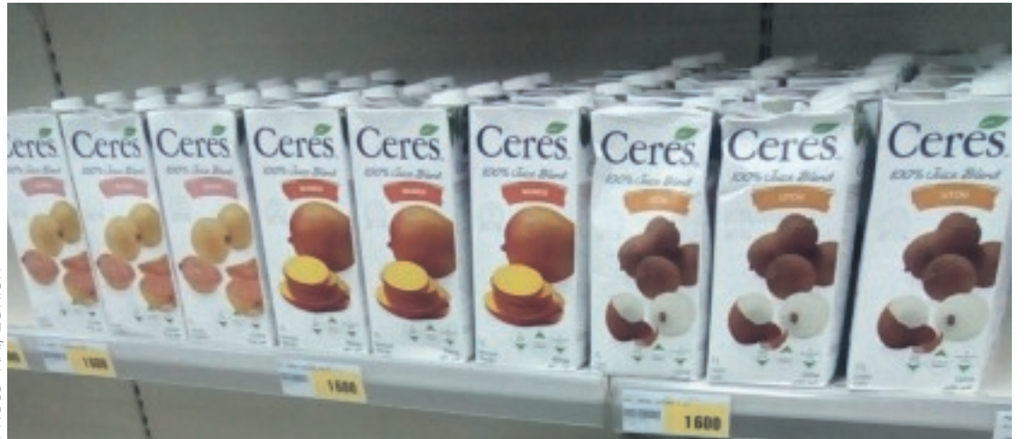
Une vue de la gamme des jus Cérés.

En cas de doute, appeler le numéro vert de la DGCC 8085.