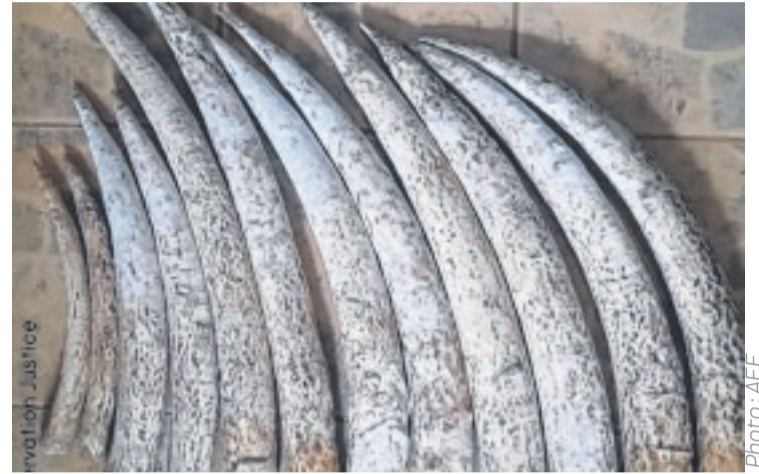
Une vue des pointes d'ivoire saisies.

C'est le 29 mai passé que le 3e complice sera interpellé. Une fois le trio reconstitué, il est acheminé à Mouila pour la suite de l'enquête. Avant son transfert sur Libreville au Tribunal spécial. Les trois hommes seront poursuivis pour détention, tentative de commercialisation,