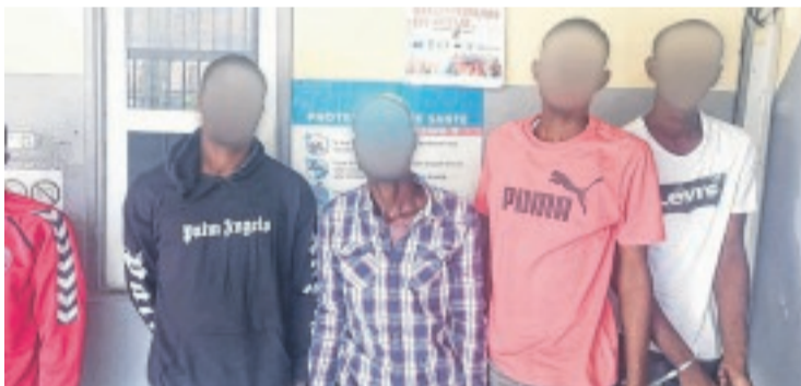
Quatre des cinq mis en cause.