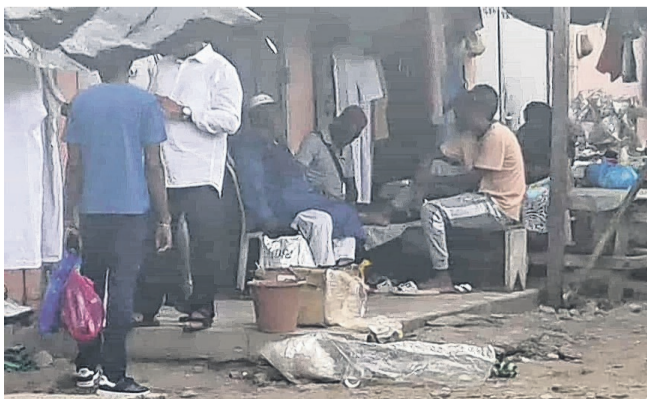
La pédicure-manucure se fait partout. Ici aux abords de la Mosquée de Grand-Village.