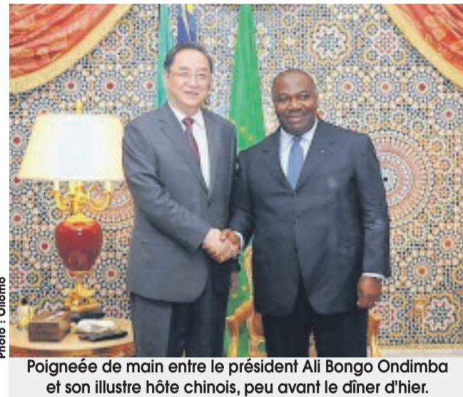
Poignée de main entre le président Ali Bongo Ondimba et son illustre hôte chinois, peu avant le dîner d'hier.

étroits, à la fois dans les domaines politique, économique, commercial, culturel, sanitaire, etc. Yu Zhengsheng a été reçu autour d'un dîner, hier au palais de la présidence de la République, par le chef de l'Etat, Ali Bongo Ondimba.