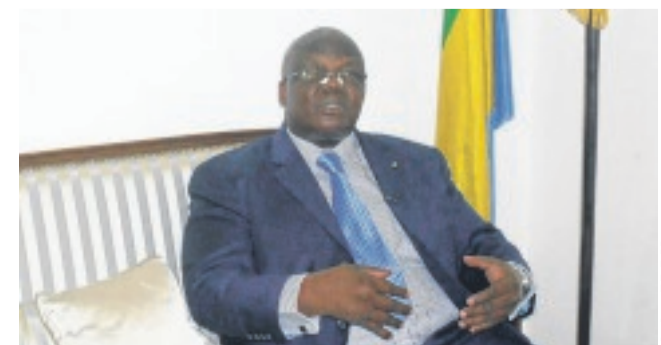
Le ministre Florentin Moussavou.

Autant de sujets – divers et variés – dont le ministre de l'Éducation nationale et de l'Éducation civique accepte de débattre à cœur ouvert.